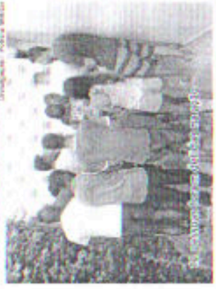
Polícia cumprindo mandados em Divinópolis e Santo Antônio do Monte.

Doze pessoas foram presas durante a operação. O grupo é suspeito de envolvimento com tráfico de drogas.